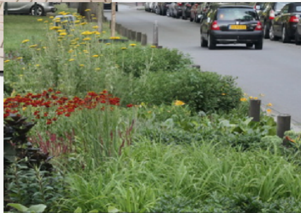
Groene border met diverse flora tussen en in de boom spiegel.